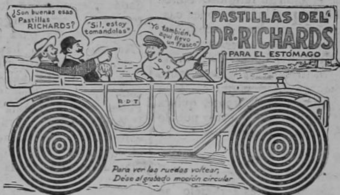
Para ver las ruedas volutar, Dése al grabado moción circular

Viaje o no viaje Ud., tenga consigo un frasco de Pastillas del Dr. Richards y otro de los Laxoconfitos. Las Pastillas del Dr. Richards entonan y fortalecen el estómago, ayudan a la digestión y evitan los desarreglos que causan jaquecas, malestar general, pesadez, cansancio, llenura, etc. Los Laxoconfitos del Dr. Richards eliminan de los intestinos las materias nocivas que se acumulan como resultado de las digestiones difíciles, y regularizan las funciones del hígado. Empiece Ud. a usarlos hoy mismo. De venta en las boticas. DR. RICHARDS DYSPEPSIA TABLET ASSOCIATION, Box 226, New York