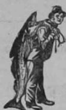
Con esta marca.

es única en su clase. Sus virtudes extraordinariamente curativas justifican nuestro consejo: